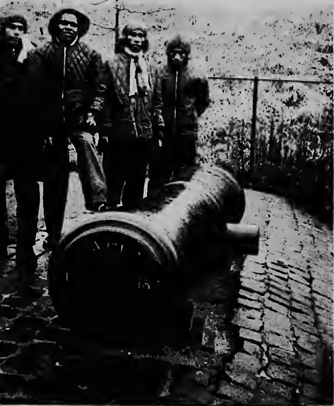
Naarden tabata un forti, lo cual por ser mirá na diferente era e cañon aki riba.